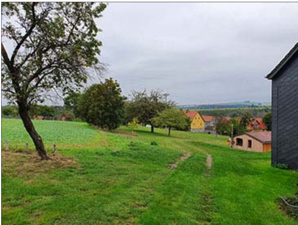
östlicher Teil des Satzungsgebietes