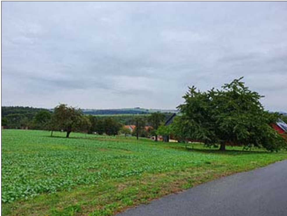
Blick auf das Satzungsgebiet von Nordwesten