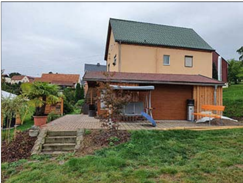
Nachbarbebauung Flurstück 74/5