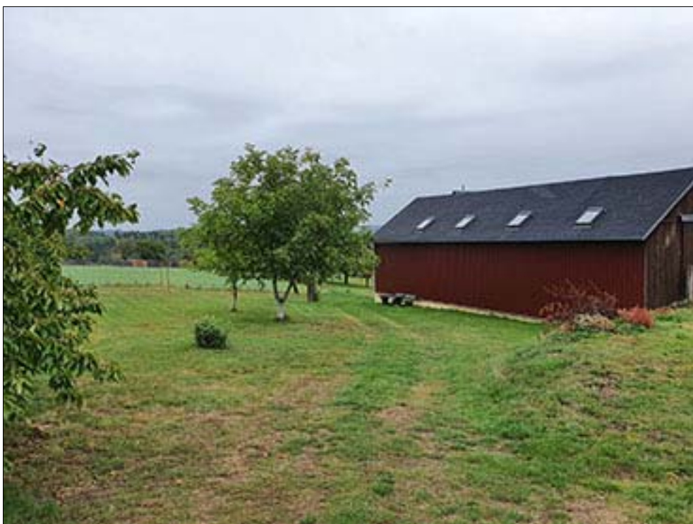
westlicher Teil des Satzungsgebietes