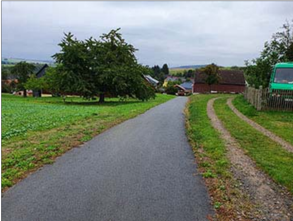
Zufahrtstraße auf Flurstück 74/4