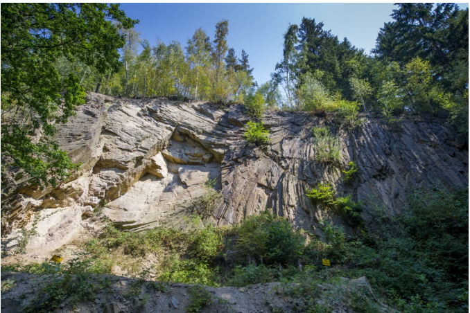
Nationales Geotop „Porphyrfächer“ bei Mohorn-Grund - ein Aushängeschild des GEOPARKs Sachsens Mitte

Bei ausreichender Qualifizierung können Geoparks ein Gütesiegel als Nationaler GeoPark Deutschlands erringen.