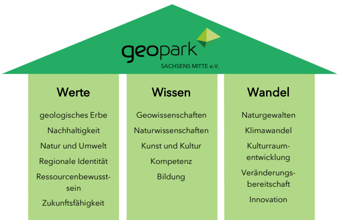
Leitbild des GEOPARKs Sachsen Mitte e.V.

Die Zusammenhänge zwischen den Geofaktoren Relief, Klima, Gestein, Boden, Wasserhaushalt, Vegetation und Zeit herzustellen, und die Kreisläufe innerhalb des Geosystems zu verstehen, ist eine weitere Aufgabe des GEOPARKs.