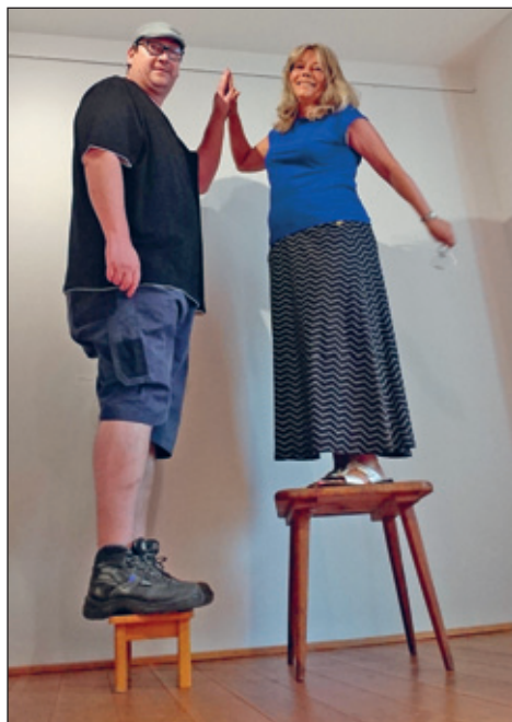
Museum kann auch Spass machen!

„Locker vom Hocker - Karikaturen vom Handwerk im Stuhlbaumuseum Rabenau“ wird am 20.10.2024 um 16:00 Uhr eröffnet.