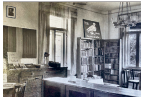
Die Bibliothek in den 70iger Jahren

Seit 1913 gab es aber auch im Hinterhaus Hainsberger Str. 20 eine „Arbeitsbücherei“. Sie war vom Holzarbeiterverband ins Leben gerufen worden und mit Buchgeschenken von den Bildhauern und dem „Naturheilverein“ unterstützt worden. Die wertvolle Bibliothek fiel mit samt den Gewerkschaftsakten 1933 im Zuge der Naziterrormassnahmen den Flammen zum Opfer.