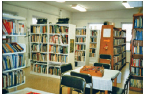
Stadtbibliothek Hauptstr. 5a

Seit 1991 besuchten nun auch die Rabenauer Kindergartengruppen regelmäßig die Bibliothek. Fördermittel vom damaligen Landkreis Freital und des Bundes ermöglichten es auch 1993 die Ausstattung und den Bestand zu erneuern. So werden seit August 1993 auch Videospiele und ein Videospiegelgerät zur Ausleihe angeboten. Diese Ausleihgüter waren damals als einzige kosten-