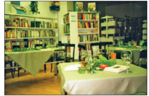
Herbstlesung mit Weinverkostung (2000)

Den seither letzten Umzug erlebte die Rabenauer Stadtbibliothek im September 2000 zum heutigen Standort Lindenstraße 4. Bei